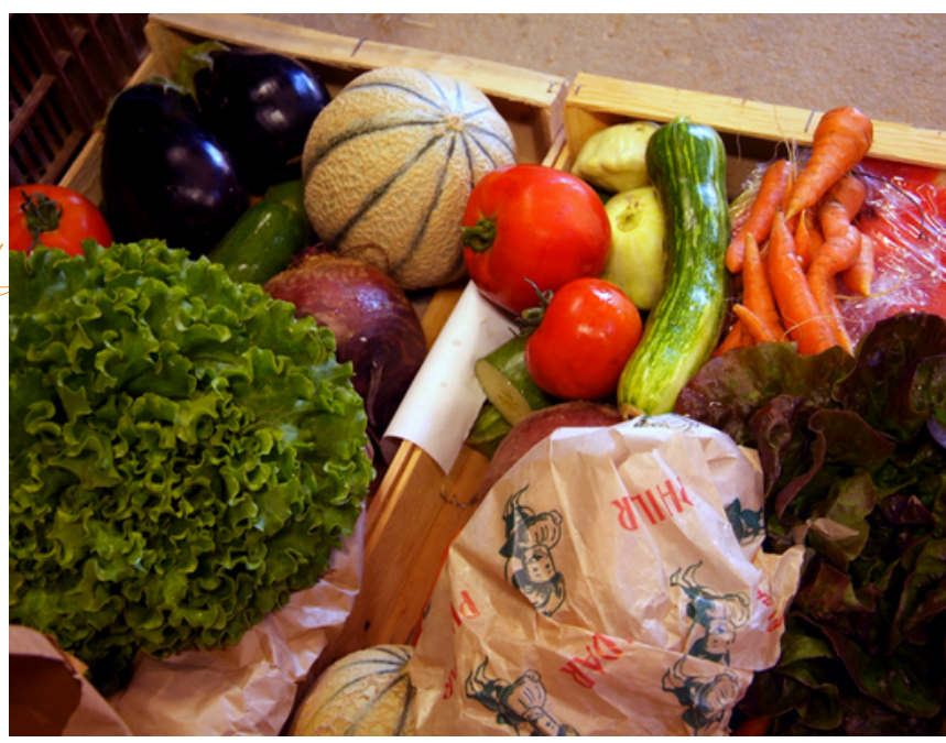
Edition Avril 2020

Pour plus d'informations et si le projet vous intéresse, contactez :